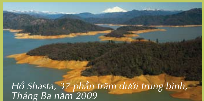
Hồ Shasta, 37 phần trăm dưới trung bình, Tháng Ba năm 2009

Để có được hướng dẫn về cách tiết kiệm nước, xem mặt bên kia của tờ truyền đơn này hoặc đến viếng trang mạng save20gallons.org .