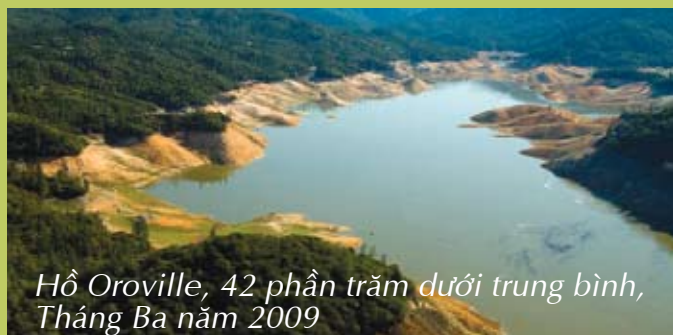
Hồ Oroville, 42 phần trăm dưới trung bình, Tháng Ba năm 2009